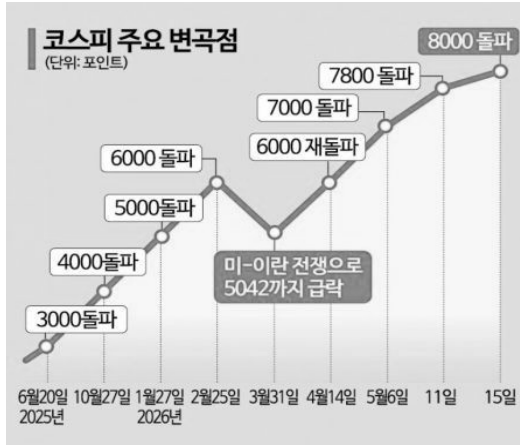
[그림] 이재명 정부 출범 1년, 코스피 지수 변화

이 대통령 취임일인 2025년 6월 4일 코스피 증가는 2,770,84였다. 2026년 5월 29일 코스피는 전 거래일 대비 3.55% 오른 8,476.15에 장을 마치며 또다시 사상 최고치를 기록했다. 이재명 정부는 '코리아 디스카운트 해소와 '주주권의 보호'를 내세우며 상법 개정을 국회에서 통과시켰다. 주요 내용은 △이사의 주주 총실의무 명문화, 감사위원 선임 시 '합산 3% 룰 강화'(1차), △집중 투표제 의무화, 분리선출 감사위원 확대(2차), △자사주 소각 의무화(3차)였다. 한편 이른바 '빛투' 즉 신용거래 용자도 급증하여, 2026년 4월 28일 현재 37.6조에 달한다. 또 주식으로 거둔 시세차익이 부동산 가격상승으로 이어진다는 분석도 있다. 국토교통부 '서울 아파트 매수 자금조달계획서'에 따르면 개인이 올해 4월 서울 아파트 매입 과정에서 활용한 주식·채권 매각대금은 총 5932억원이다. 이는 전년 동기 대비 380.4%, 전월 대비 62.3% 증가한 수치다. (출처: 《아시아경제》)