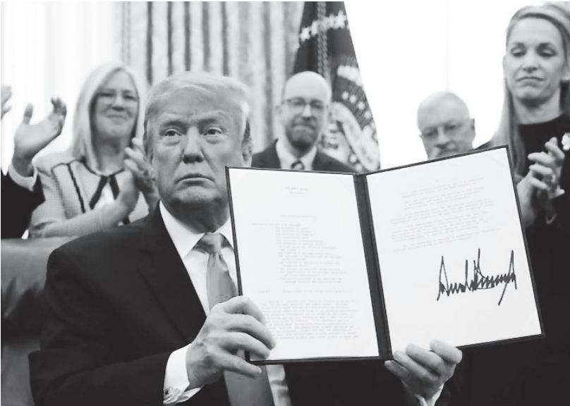
도널드 트럼프 미국 대통령이 2019년 2월 19일, 백악관 집무실에서 '우주정책명령4'에 서명한 뒤, 서명서를 들어 보이고 있다. 우주군은 인공위성을 이용한 감시, 정찰, 탄도미사일 탐지 및 요격 작전, 적국 위성파괴 등의 임무를 수행한다. 이를 통해 미국 '킬-체인'의 핵심인 정찰 및 탐지능력을 방어하는 한편 적국의 탐지능력을 파괴하여 군사작전에서 주도권을 확보한다.

정리하면 미국은 2019년에 들어오면서 경제적으로도 군사적으로도 중국에 대한 경쟁을 노골화하면서, 불필요한 충돌은 피하겠지만 피할 수 없는 충돌에서는 이길 수 있도록 한다는 기조를 명시적으로 드러냈다. 미국은 과거 1990년대 대만 해협 위기에서 미국이 대만을 중국으로부터 방어해주겠다고 공언하면서 중국의 군비확장 1기가 시작되었다는 것을 모를 리 없음에도, 최근 대만을 '국가'로 지칭하며 중국을 자극하기도 했다. 따라서 미국의 중국과 러시아에 대한 노골적인 견제는 2020년에는 더욱 심화될 것이라 전망할 수 있다. 특히 2020년 말, 트럼프 대통령의 재선이라는 큰 이벤트가 남아있는 상황에서 트럼프 행정부는 재선 가능성을 높이기 위