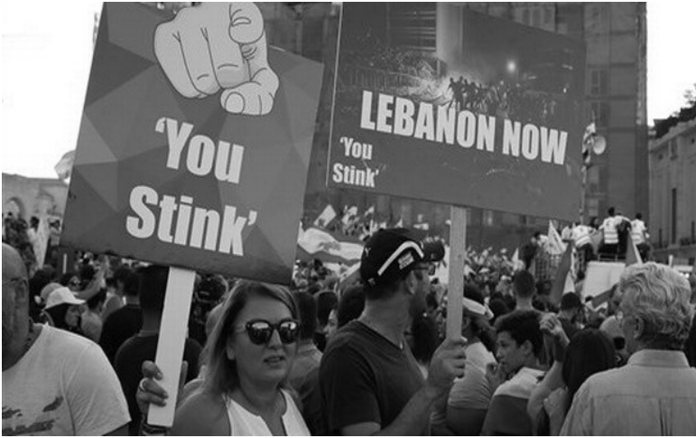
레바논 '유 스팅크(You Stink!)' 시위 사진

다. 레바논 위정자들은 마크롱 프랑스 대통령이 현장을 방문하기 전까지 피해 지역을 찾지 않았으며, 사태 수습은 정부가 아닌 시민사회와 적십자사가 맡았다.