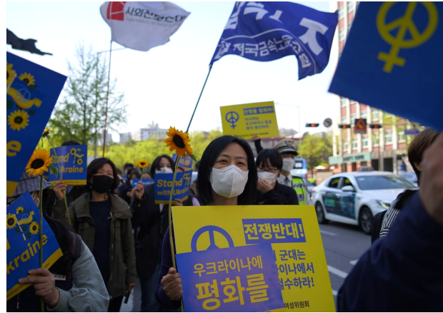
전쟁반대 평화행진 (2022.4.16)