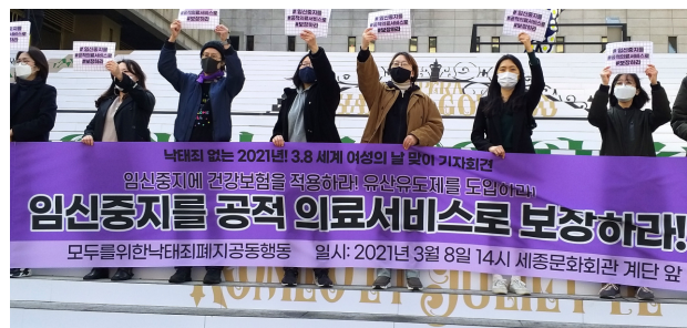
모두를위한낙태죄폐지공동행동 3.8 세계 여성의날 맞아 기자회견 (2021.3.8)

'기रो에 선 세계의 평화-러시아의 우크라이나 침공이 우리에게 던지는 질문들'