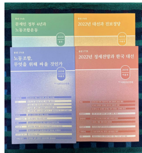
계간 <사회진보연대> 발간